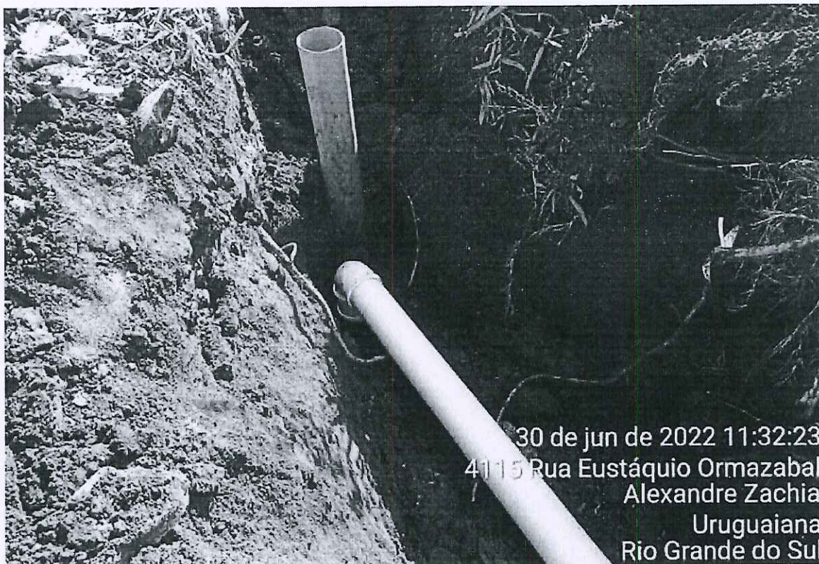
Imagem 01 – Ramal da residência conectada à rede coletora de esgoto.