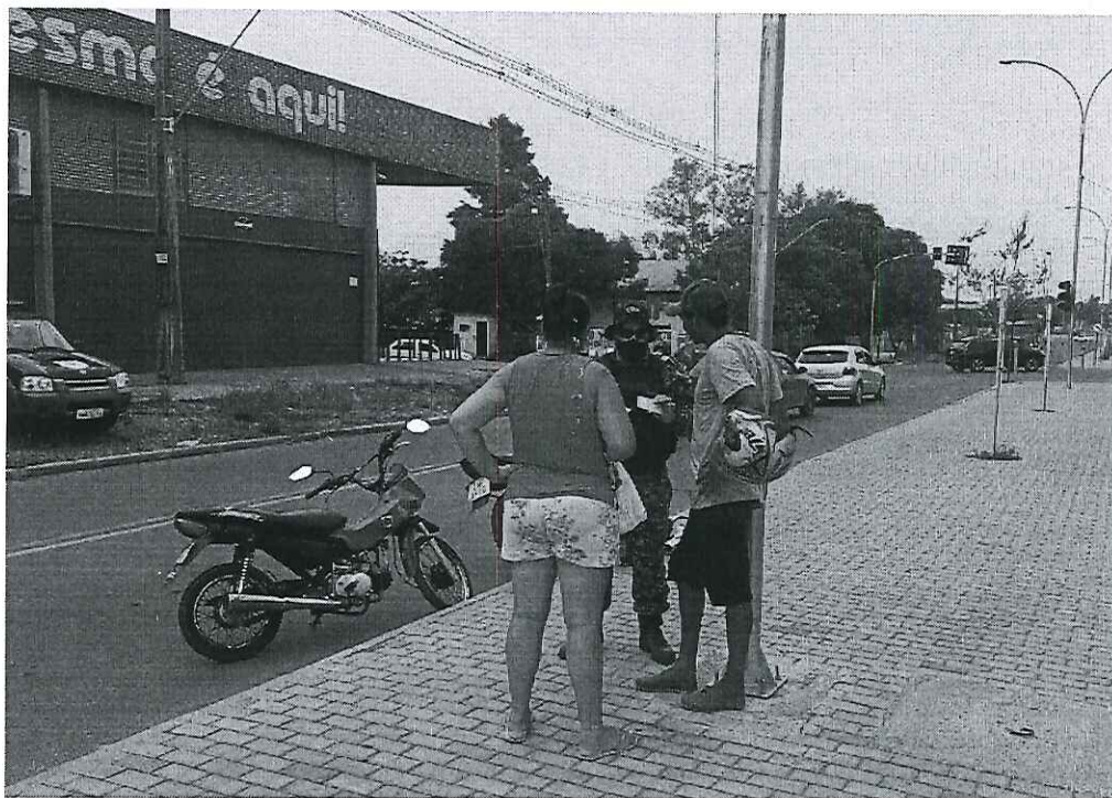
Avenida Setembrino de Carvalho