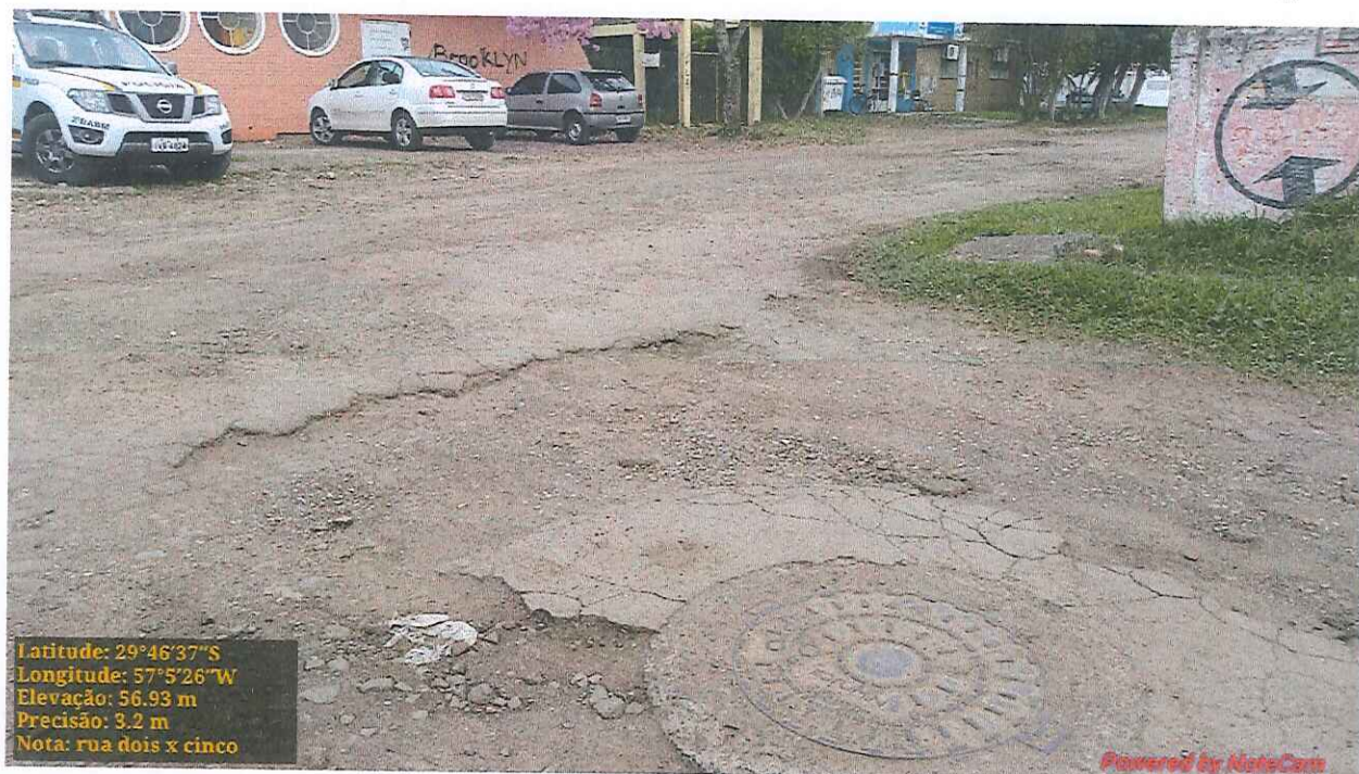
Foto 04: Visão da Rua Cinco entre a esquina com a Rua Dois e a parada de ônibus da Rua Cel. Flodoardo M. da Silva.