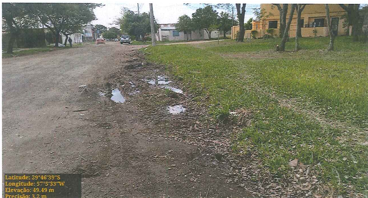
Foto 02: Demonstra a boca de lobo no cruzamento da Rua Seis com a Rua Íris Valls

Foto 01: Demonstra as condições da via pública, com acúmulo de água, no cruzamento da Rua Seis com a Rua Íris Valls