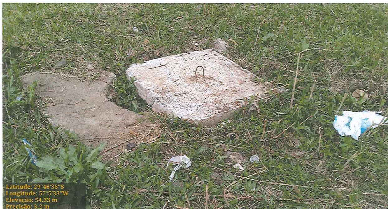
Foto 03: Demonstra a condição da via pública, no cruzamento da Rua Dois com a Rua Cinco

Foto 02: Demonstra a boca de lobo no cruzamento da Rua Seis com a Rua Íris Valls