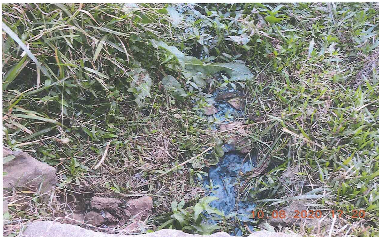
Fotos 06 a 10: Demonstram o valo construído para que a água excedente possa se conectar a água da galeria que passa sob a BR-472.