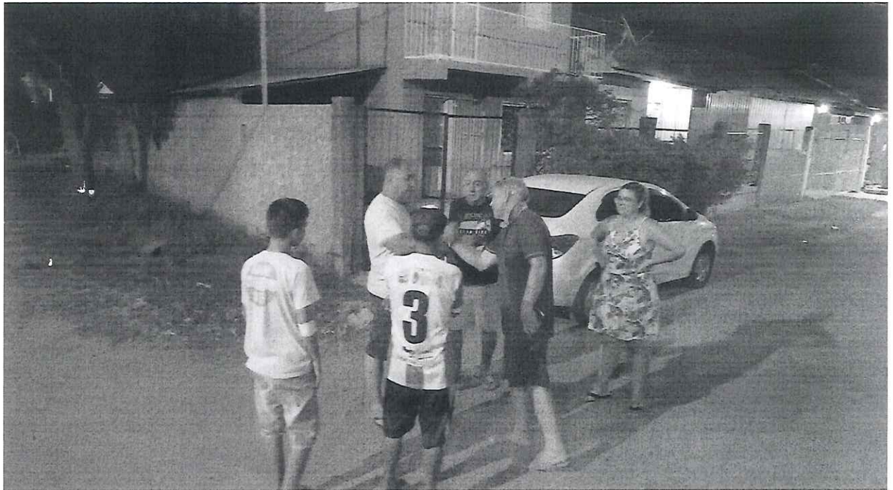
Quadra A e B – Bairro Rui Ramos