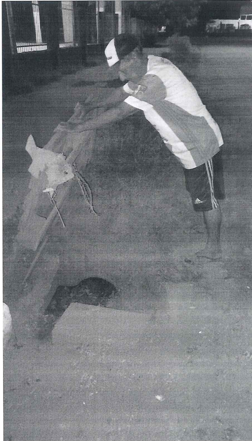
Quadra A – Moradores adaptaram uma tampa