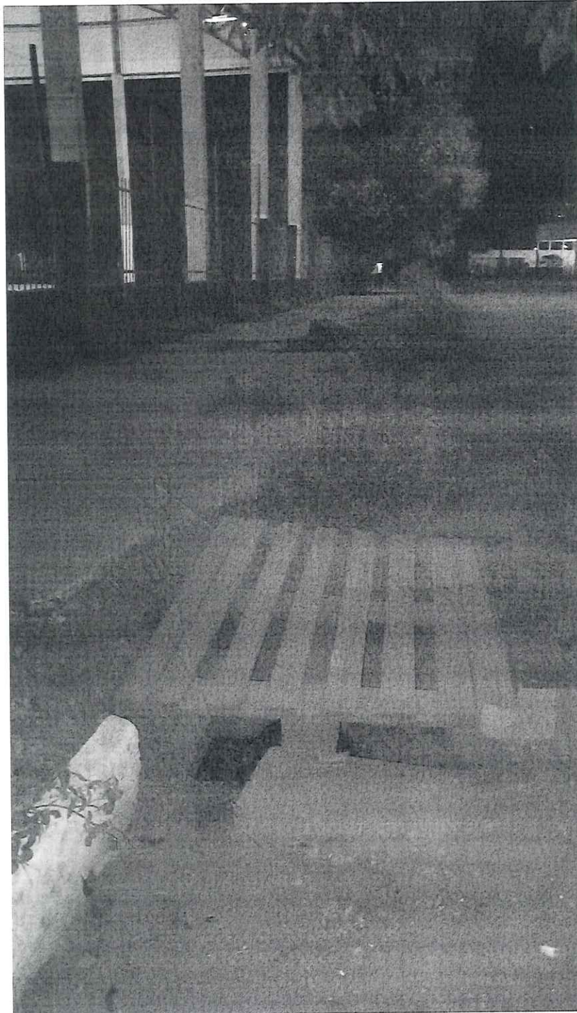
Quadra A – ao lado da EMEF. Dom Bosco Bueiro entupido e sem tampa