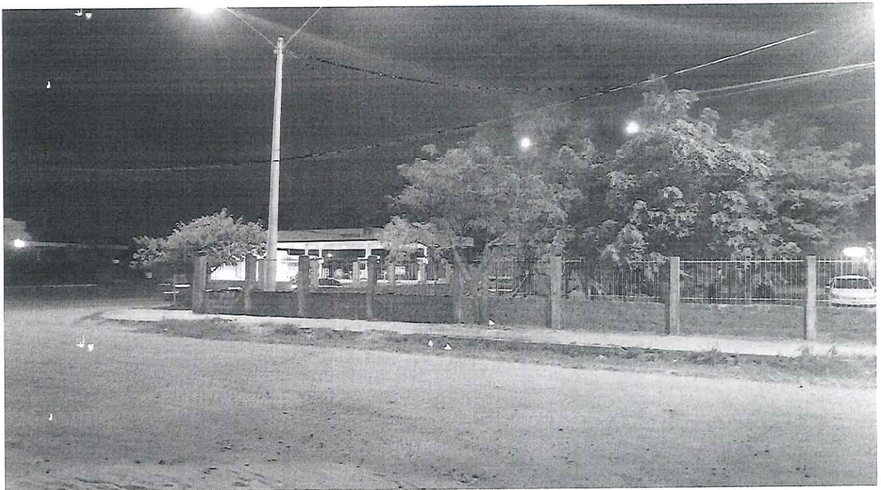
Quadra A - (calçada da EMEF. Dom Bosco)