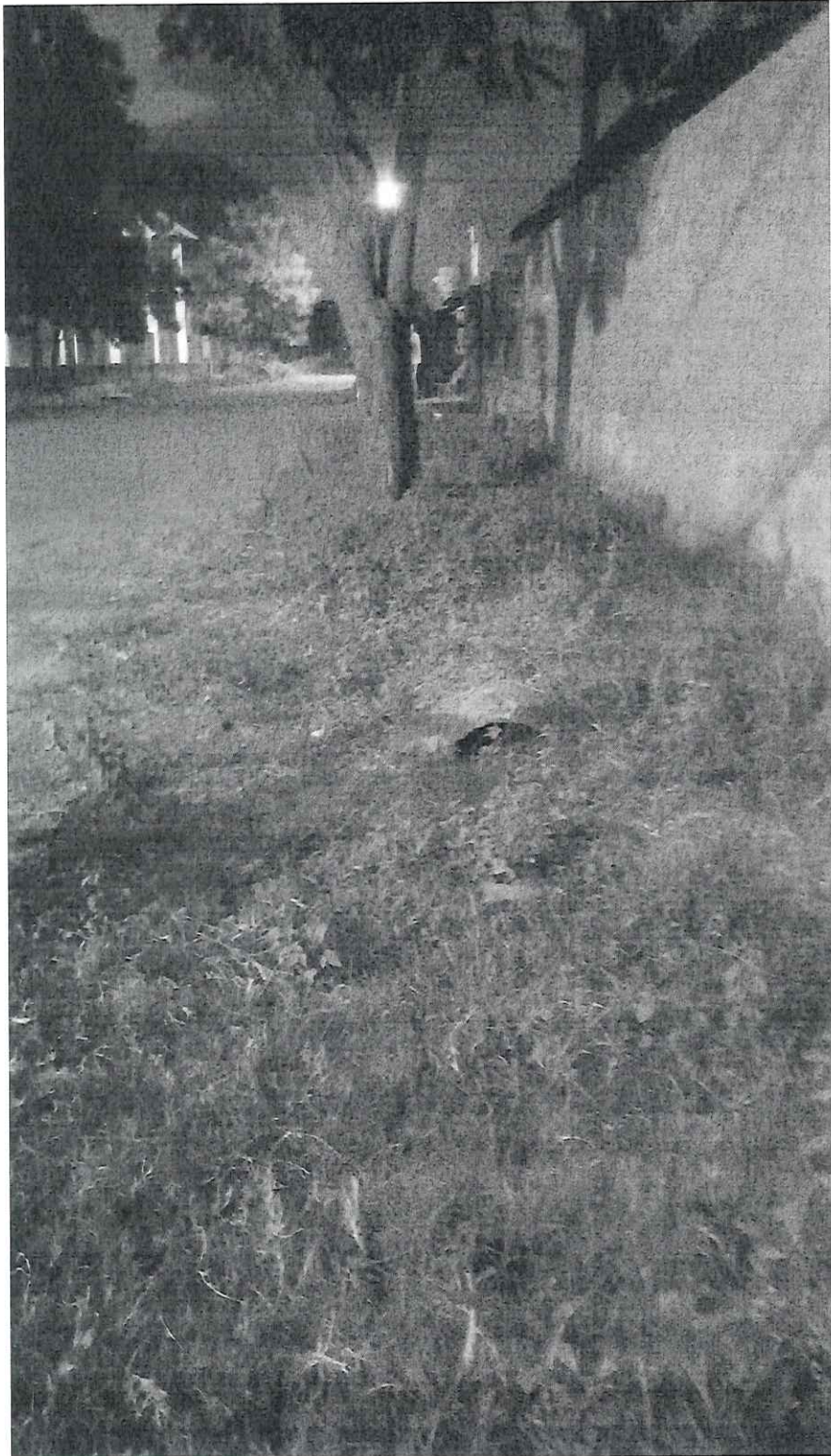
Sistema Pluvial com problemas (Quadra A)