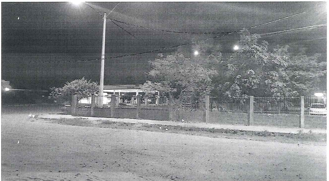
Quadra A e B – Bairro Rui Ramos