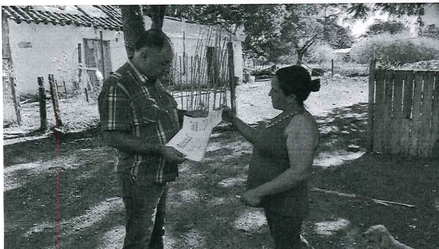
Rua Iris Valls nº 4482, Bairro Rio Branco (Apresentação dos Demonstrativos Mensais de Serviços de Água e Esgoto)

O Vereador disponibiliza ainda as imagens registradas no local.