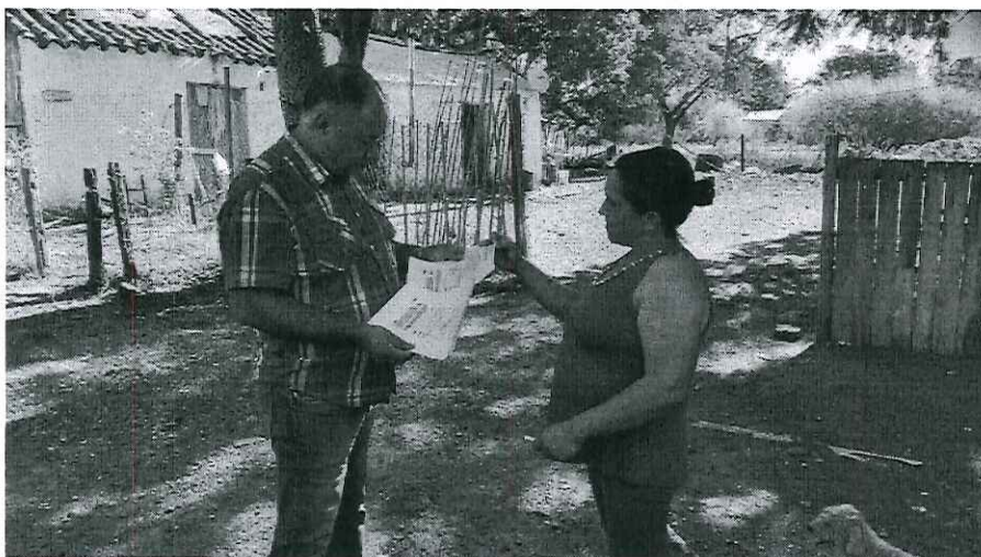
Rua Iris Valls nº 4482, Bairro Rio Branco (Apresentação dos Demonstrativos Mensais de Serviços de Água e Esgoto)

i) O Vereador disponibiliza ainda as imagens registradas no local.