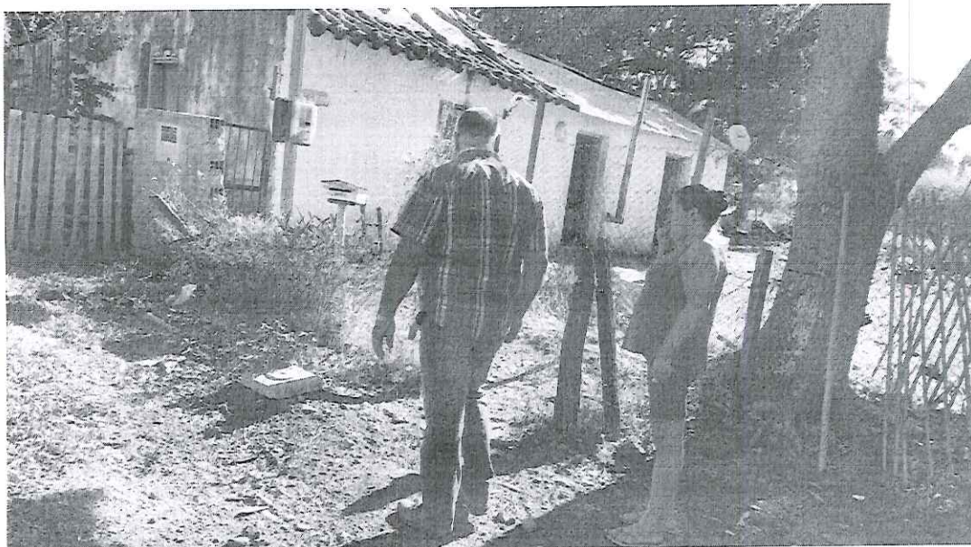
Rua Iris Valls nº 4482, Bairro Rio Branco