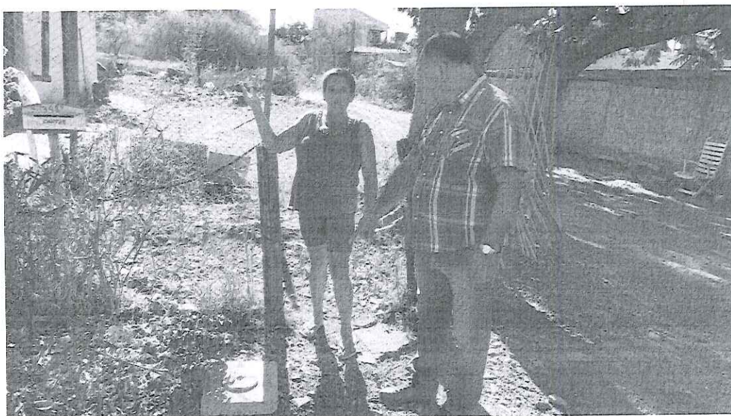
Rua Iris Valls nº 4482, Bairro Rio Branco