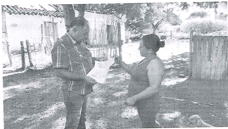
Rua Iris Valls nº 4482, Bairro Rio Branco (Apresentação dos Demonstrativos Mensais de Serviços de Água e Esgoto)