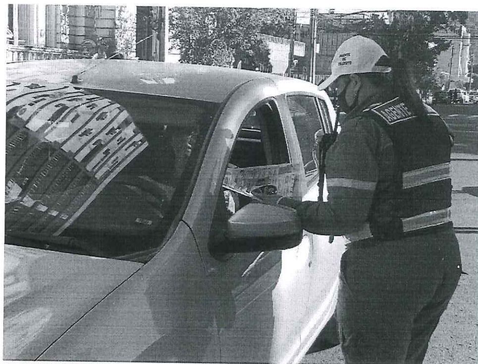
Educação para o Trânsito - Maio Amarelo