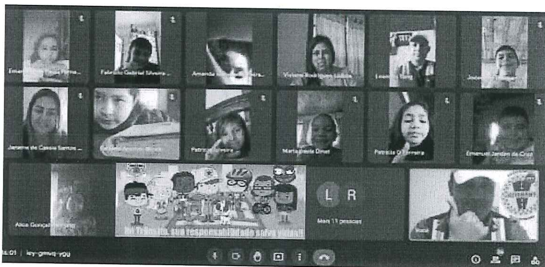
Educação para o Trânsito – Escolas