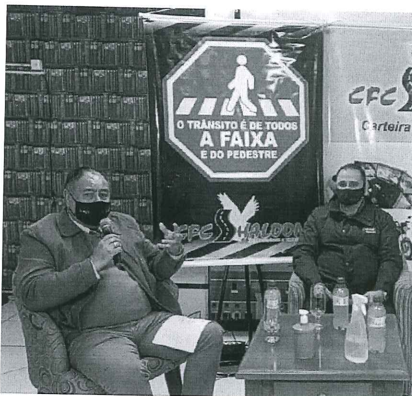
Educação para o Trânsito – Entidades