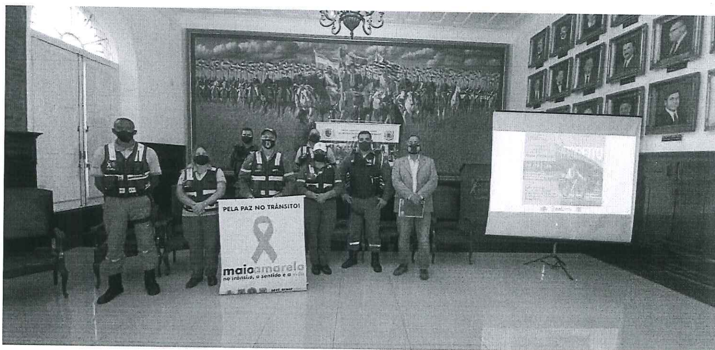
Educação para Trânsito