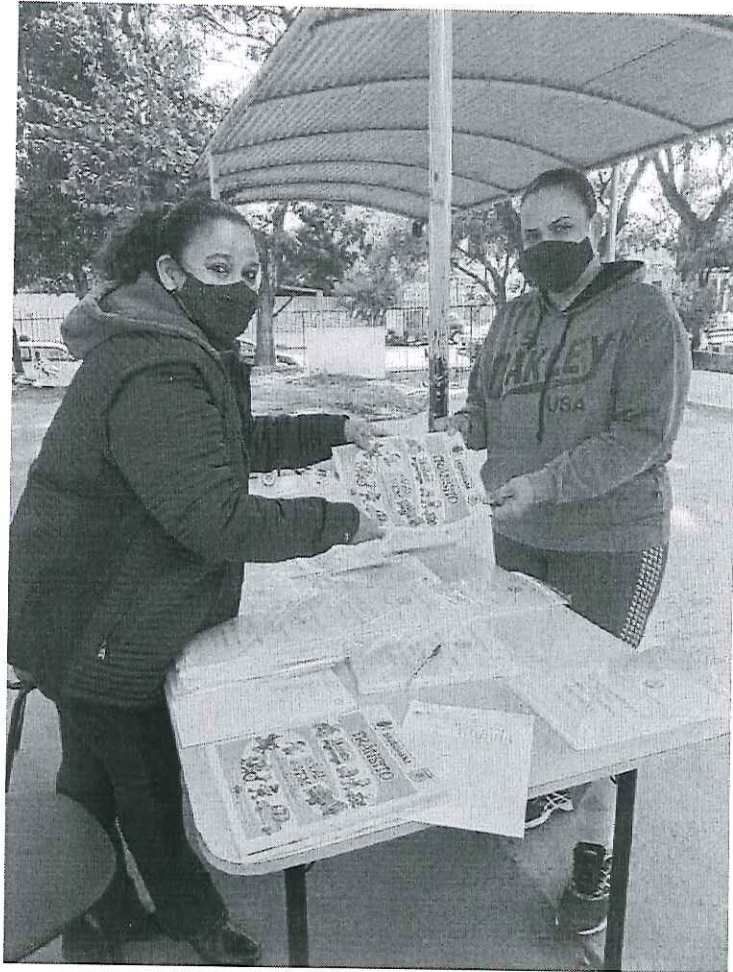
Educação para o Trânsito – Escolas