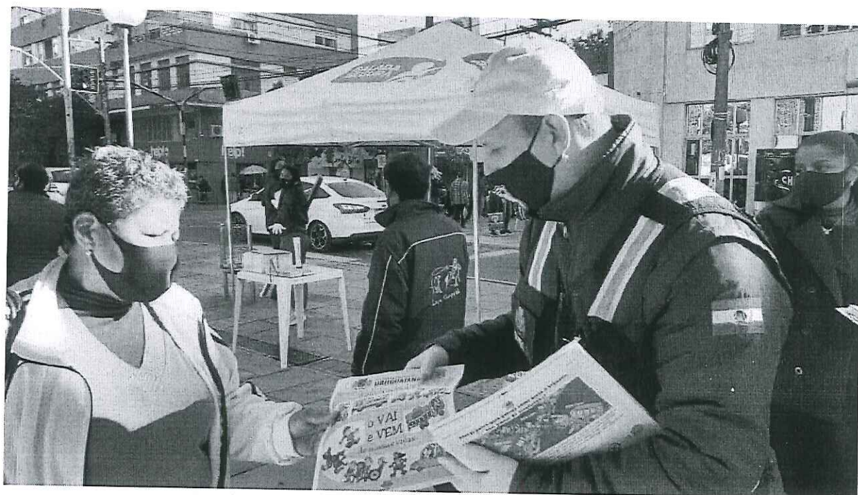
Educação para o Trânsito