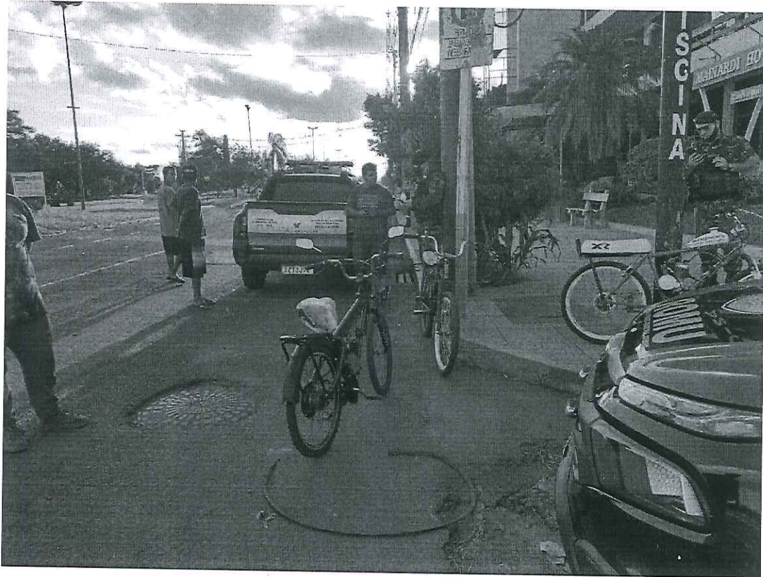
Fiscalização de Trânsito e Segurança