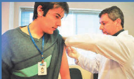
Vacinação ocorreu também dentro da sede da ABTI.