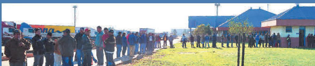
Motoristas fizeram fila para receber a dose da vacina no CUF em São Borja.

Entidades do setor iniciam campanha de vacinação na ELOG em Uruguiana.